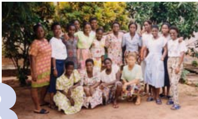
Togoville accueille les jeunes filles aspirantes, en session (1995).

À Togoville, dans le diocèse d'Aneho, les Sœurs avaient un petit pied-à-terre, offert en son temps par Mgr Henri Salina, Abbé de Saint-Maurice. Une nouvelle maison est construite, ayant pour but également un Foyer d'accueil, soit de jeunes étudiantes, soit de personnes ou de groupes en recherche d'un lieu de silence et de prière.