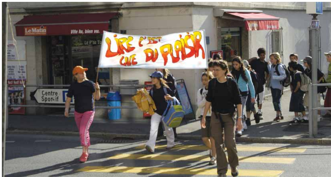
Le 23 avril, journée du livre, les élèves de Saint-Maurice se passionnent pour le sujet.

titudes et appréciations occupent l'espace. Tant les cortèges d'interrogations, de doutes, mais encore de protestations se forment, s'ébranlent. Disent certains. Le livre connaît le silence;