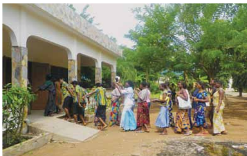
La rentrée scolaire de la deuxième promotion des filles du CFLC à Kpalimé.

J'ai commencé par être libraire durant un mois et demi. À la fin septembre, je suis allée à Kpalimé pour donner des cours de français à des jeunes filles qui apprennent la couture, la broderie, la cuisine, le français, le savoir-vivre (au Centre de Formation Louis Cergneux). J'y suis restée 3 mois. Cette période passée à Kpalimé